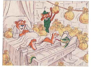
Se originalskisserna till flera Disneyklassiker.