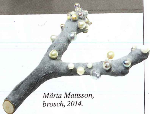
Märta Mattsson, brosch, 2014.