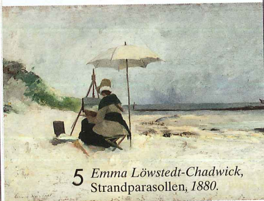
5 Emma Löwstedt-Chadwick, Strandparasollen, 1880.