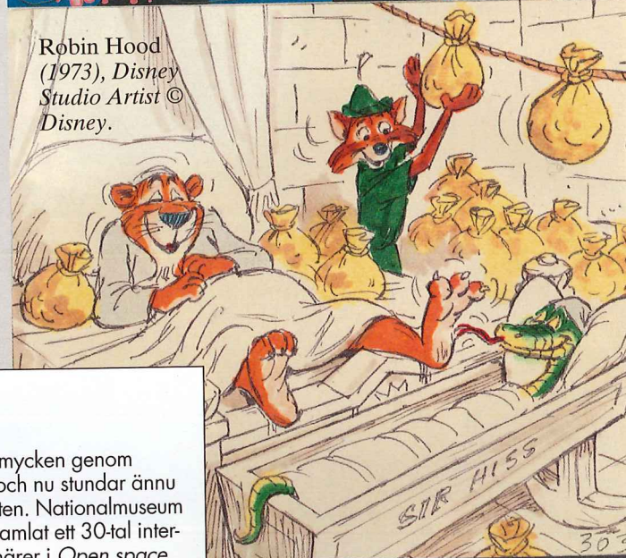
Robin Hood (1973), Disney Studio Artist © Disney.