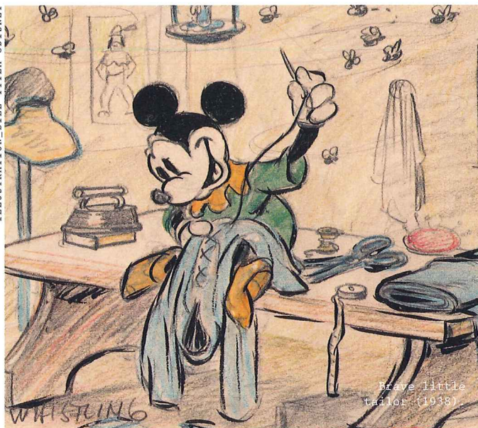
ILLUSTRATION_BILL TYTLA ODISEY

Hitta fler konstrundor i Skåne på visitskane.com .