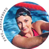
Sarah Sjöström tävlar i Stockholm.