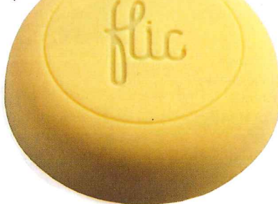
Selfiepinnen är sååå 2014!

Swim Open Stockholm på Eriksdalsbadet 30 mars–2 april är den största simtävlingen i Sverige sedan kortbane-VM i Göteborg 1997. swimopenstockholm.se