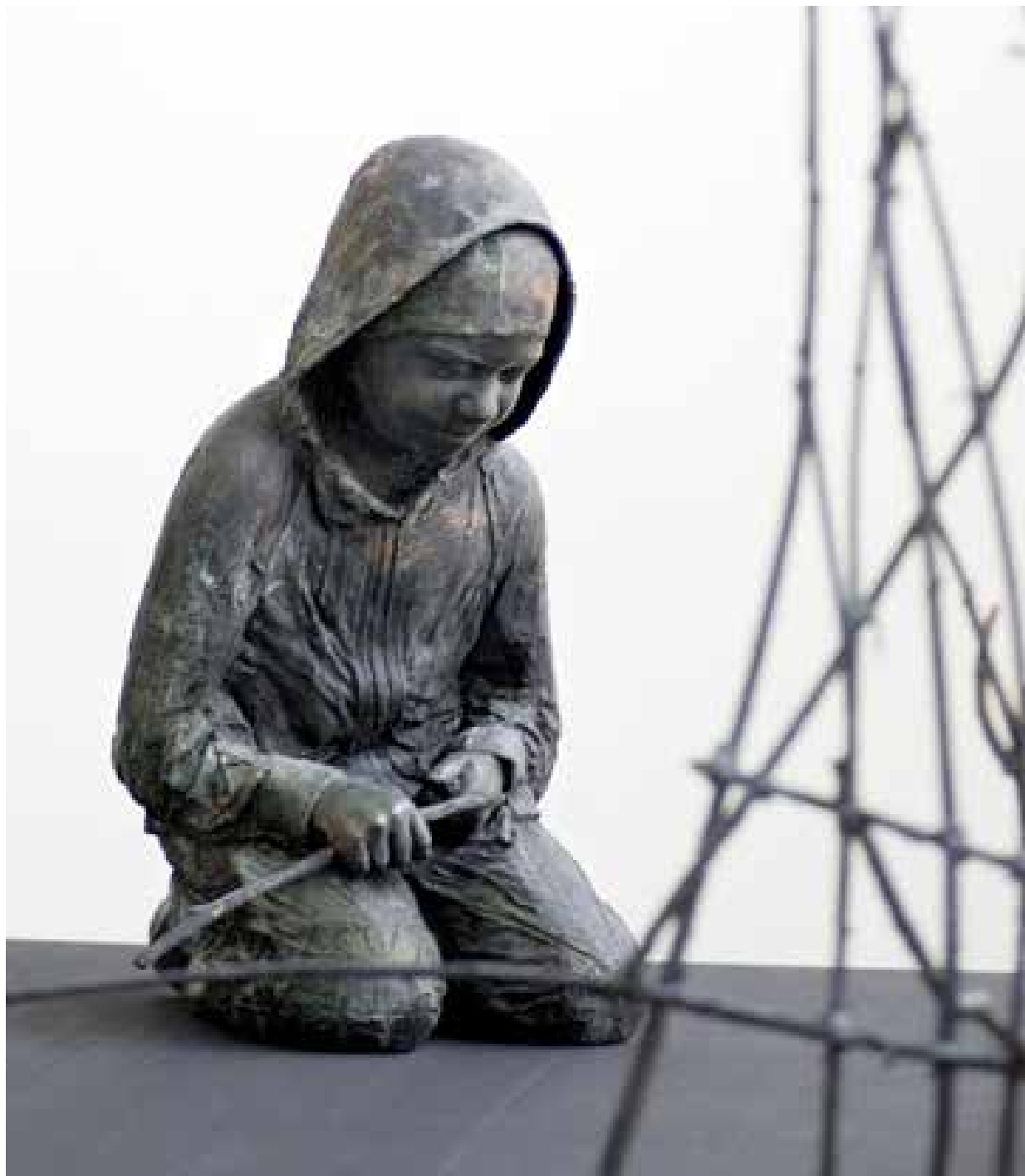
Knutte Wester. En koja åt min bror (2013)