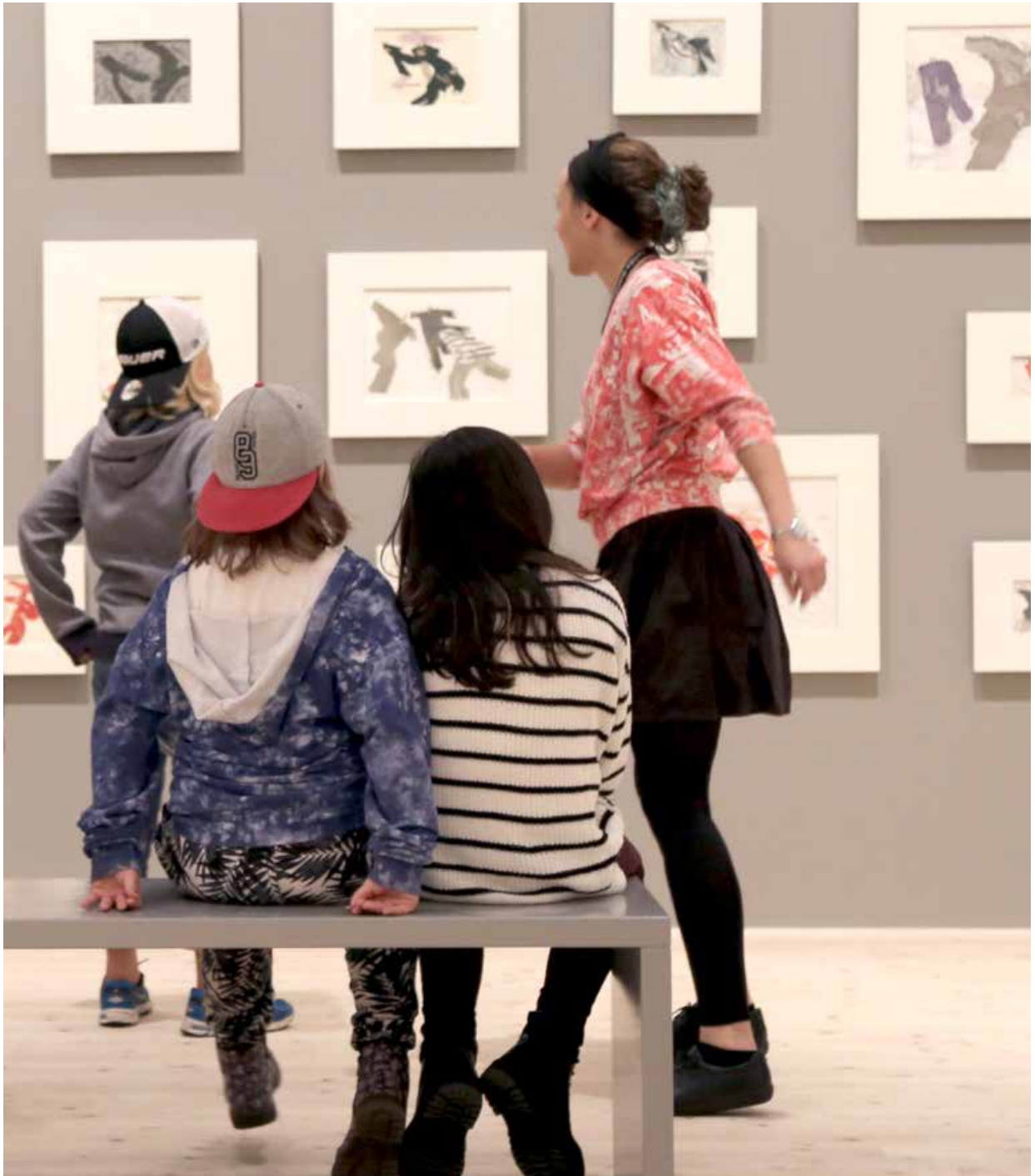
Rönnäns skola på besök på Nordiska Akvarellmuseet 2016.