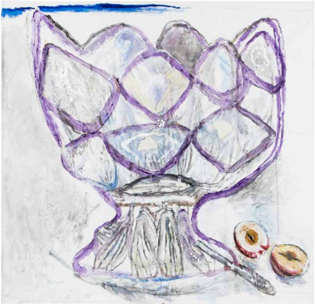
Birgit Broms, Glasskål V, 2006 Blandteknik på duk, The Estate of Birgit Broms