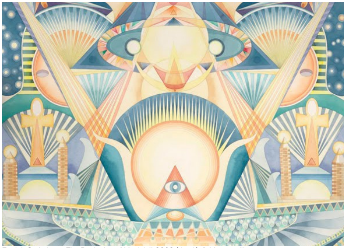
Fredrik Söderberg, The Beginning of Magick II , 2008 (detalj)

jubileumsprogram / konstkvällar / dansäventyr / akvarellverkstäder